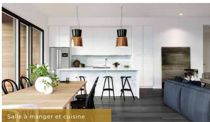
Salle à manger et cuisine