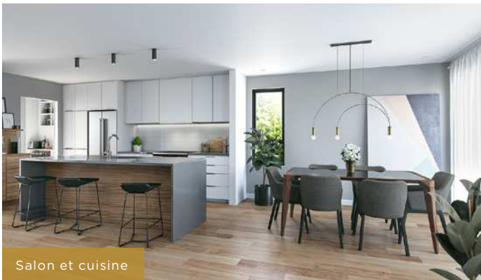
Salon et cuisine